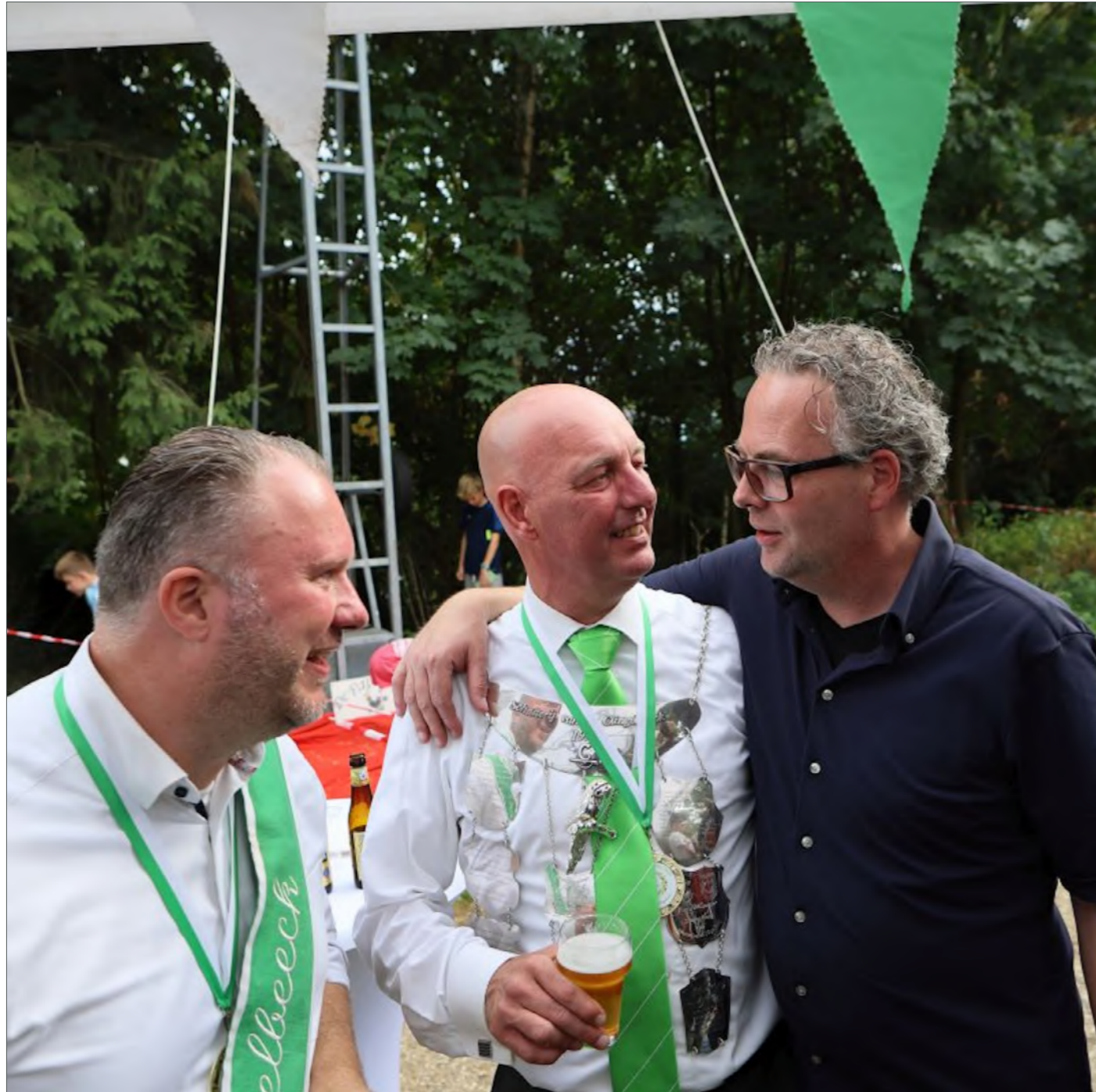
"Anyone can buy a good house, but good neighbors are priceless."