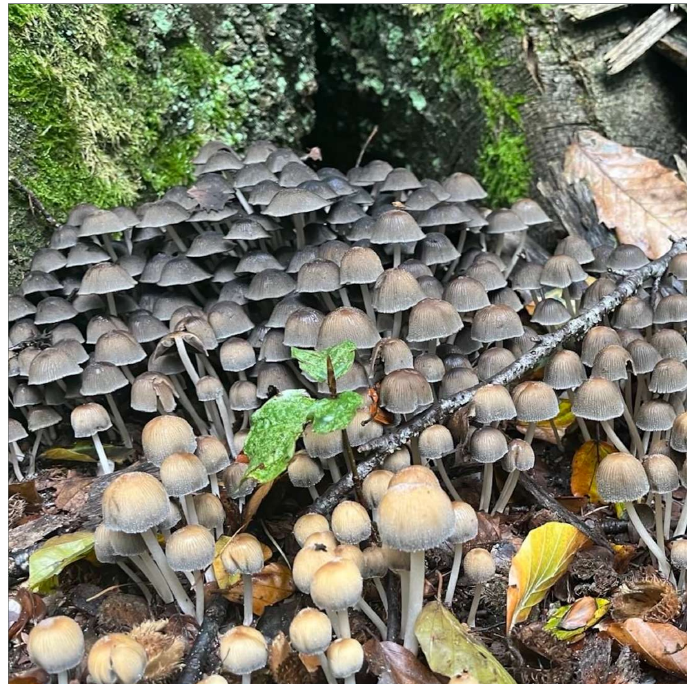
Het leven is goed in onze mooie groene wijk...!