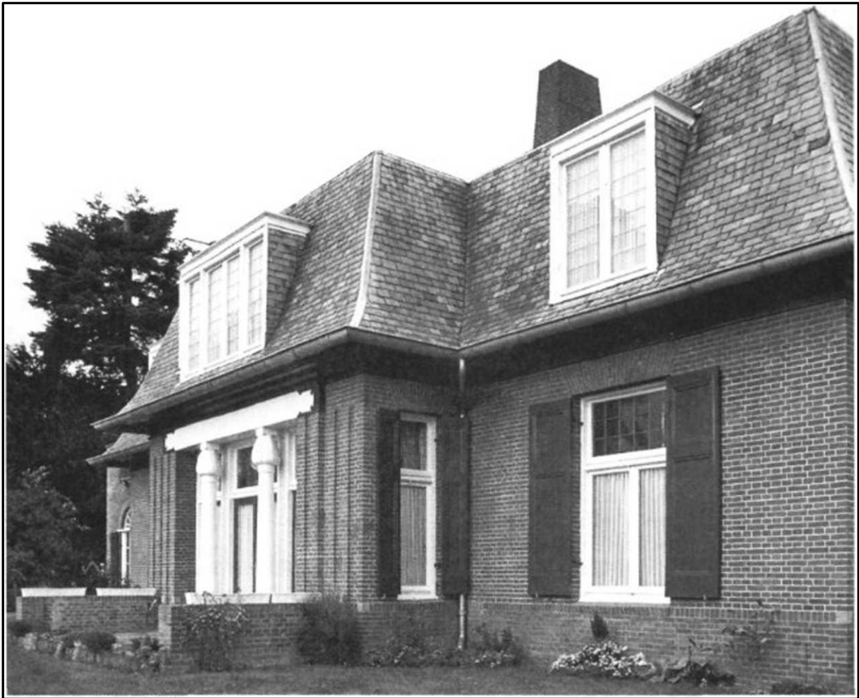
Utrechtseweg 284.

In het artikel over het landhuis 'Arva' in Velp, dat is opgenomen in het decembernummer van Arnhem de Genoeglijkste van 2006, is het huis Utrechtseweg 284 abusievelijk vermeld als Amsterdamseweg 284. Het huis aan de Utrechtseweg, dat oorspronkelijk het nummer 164 had, werd genoemd als voorbeeld van de invloed van de Duitse landhuisbouw. In de eerste decennia van de twintigste eeuw publiceerde de Duitse architect Hermann Muthesius veel over de nieuwe Britse en Duitse landhuisarchitectuur. Het Arnhemse architectenbureau Freem en Bremer ontwierp in die tijd verschillende huizen in 'Um 1800'-stijl en in Engelse Landhuisstijl.